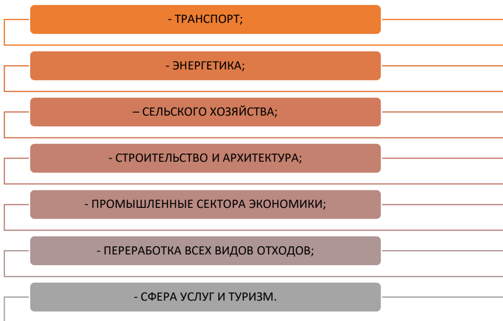
Рисунок 1 - Зеленые технологии по отраслям Казахстана

Сегодня можно найти предложения по внедрению «зеленых» технологий во всех сферах человеческой деятельности. Учитывая широкий спектр применения "зеленых" технологий, стоит говорить о возможных возможностях их применения для различных целей в секторах экономики. Особенно следует обратить внимание представителей бизнеса и региональных органов власти на «зеленые» технологии при организации индустриальных и технопарков для строительства новых объектов промышленности.